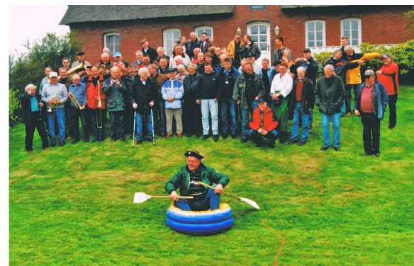
Vatertag auf Pellworm